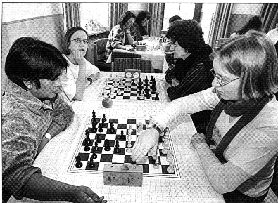
Faszination Blitzschach: Die besten Damen Bayerns ermittelten heuer ihre Meister in Freising.