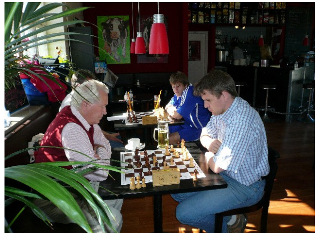
Schach in der Schlüterbar an der Münchner Straße, anschließend Fußball am Seilerbrüchl