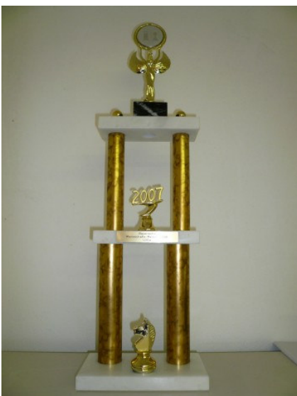
1.Platz: SK Freising