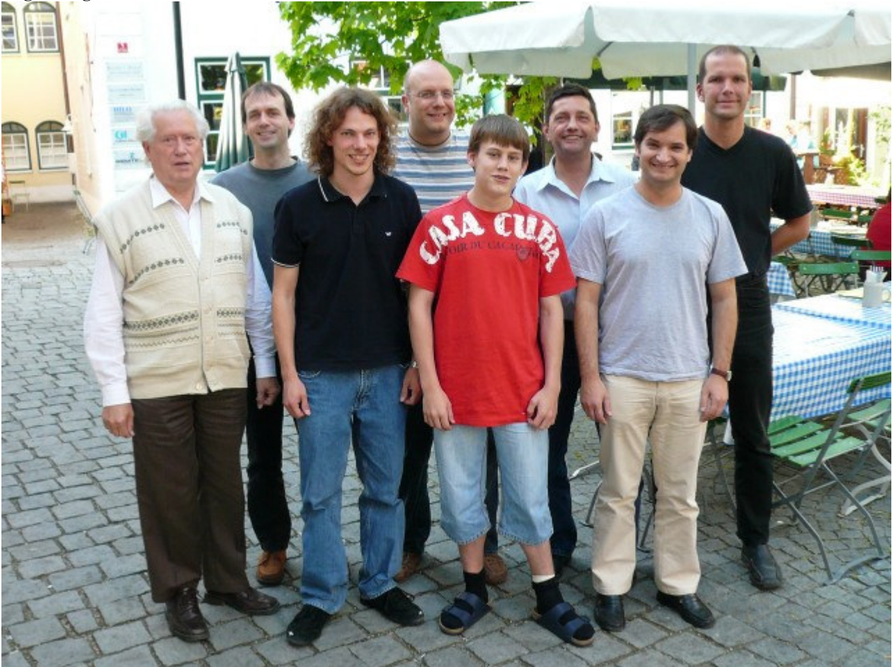
1.Platz: SK Freising