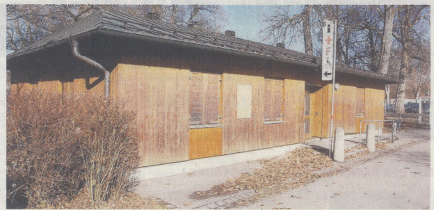
Wo beim Volksfest die Verletzten verarztet werden, dort tummeln sich an den Spielabenden die Mitglieder des Schachklubs.