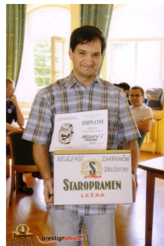
Von den 25.teilnehmenden Mannschaften belegte die Spielgemeinschaft "Prátelství I Praha - Freising" den ersten Platz der ausländischen Mannschaften und in der Gesamtwertung den 8.Platz.