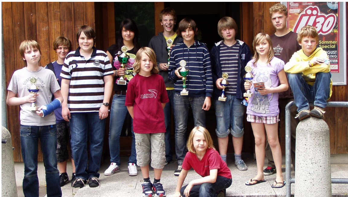
Die Preisgewinner und alle Teilnehmer