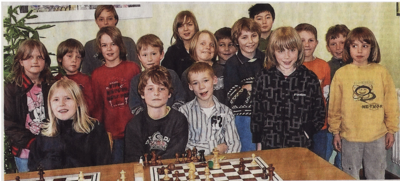
Gemeinsam am Schachbrett: Freisinger und Neufahrner Nachwuchs-Denksportler bei einem Vergleichskampf.