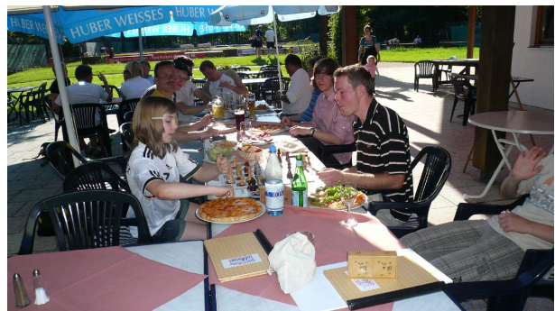
am Sonntag, 06.06.2010 im Ristorante Le Ginestre beim Tennisclub Rot-Weiss im Sportpark Savoyer Au mit allen Vereinsmitgliedern