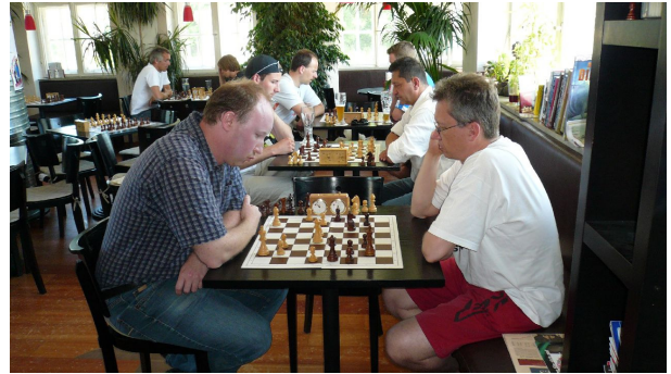
am Sonntag, 06.06.2010 in der Schlüterbar