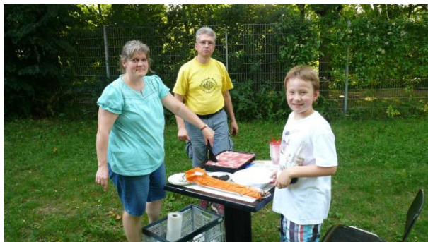
Dieses Jahr gab es zwei Termine für Schnellschachturniere am Samstag, anschließend wurde gegrillt.