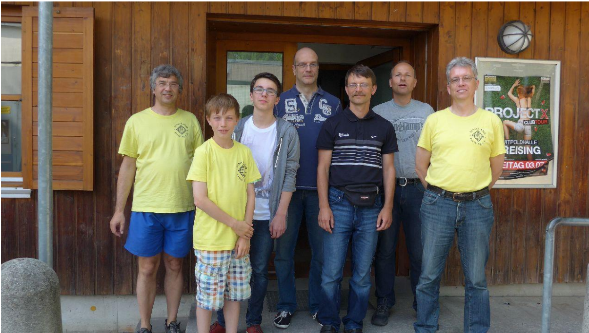
Gruppenfoto mit einem Teil der 11 Teilnehmer.