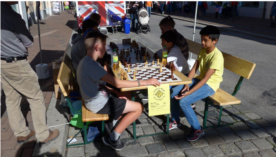
Beim KinderSpaßTag in der Freisinger Innenstadt interessierten sich einige Jugendliche für das Schachspiel. Herzlichen Dank an alle, die dabei mitgeholfen haben!