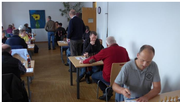
Bei den Heimkämpfen spielten erstmals alle Freisinger Mannschaften gemeinsam im Viva Vita.