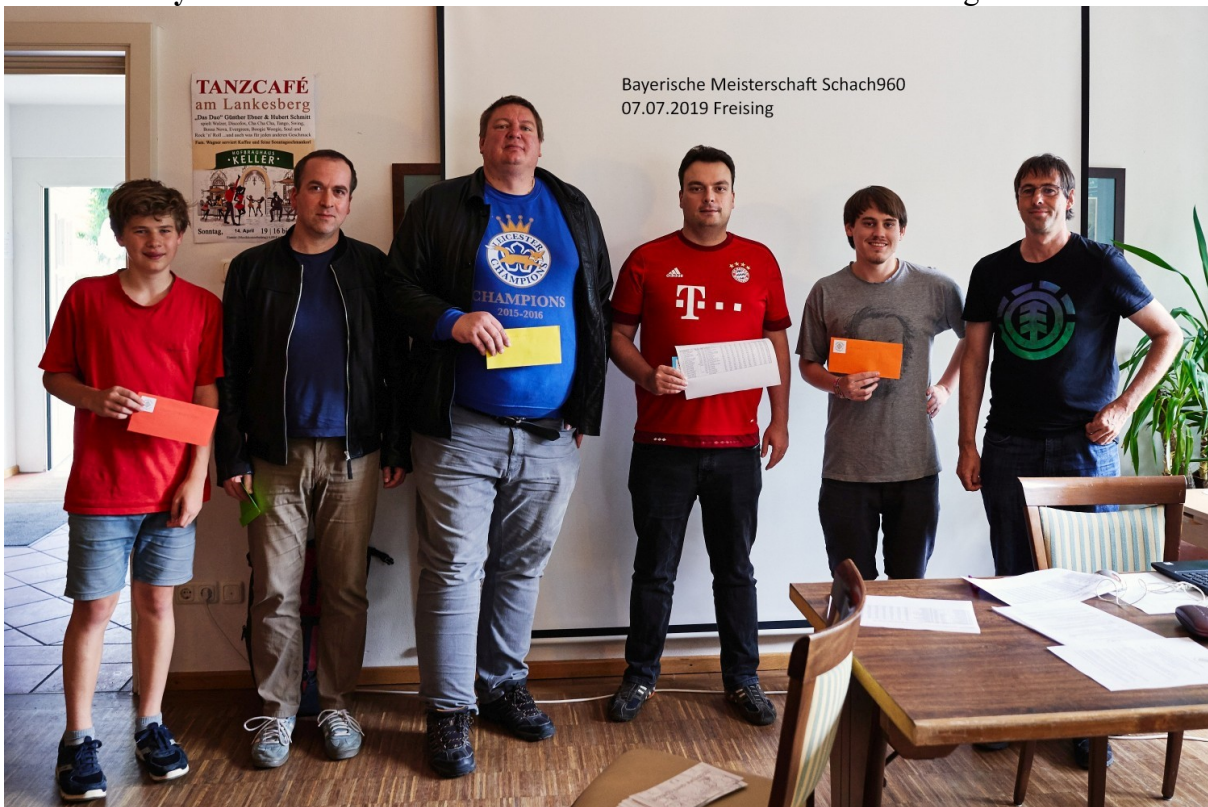
Bayerische Meisterschaft Schach960 07.07.2019 Freising